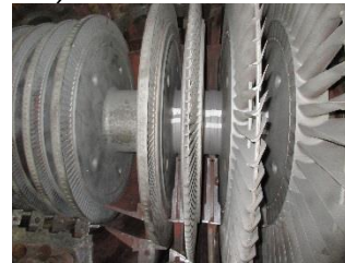
Замена проточной части 2ПТН-Б