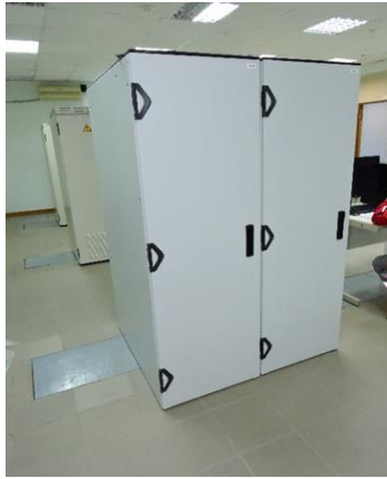
Шкафы серверов ПТК