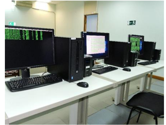
Автоматизированные рабочие места