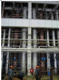
Замена элементов ГПП и опорно-подвесной системы

(Замена элементов КПП ВД II ст. (4 ход) энергоблока ст. №6; техническое перевооружение элементов паропровода ГПП и опорно-подвесной системы (Lisega) блока 800 МВт энергоблока ст. №2 (с разработкой проекта); модернизация питательного турбонасоса 2Б энергоблока ст. №2).