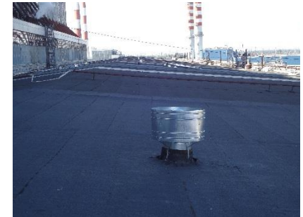
Установка новых дефлекторов