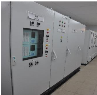
Новая система возбуждения

(реконструкция системы возбуждения энергоблока ст. №2 «под ключ»; модернизация ротора генератора ТВВ-800-2ЕУЗ; реконструкция ЩПТ энергоблоков ст. №№ 2, 6; выполнение электроснабжения приводов задвижек аварийного слива масла через АВР по двум независимым кабельным линиям энергоблоков ст.№№ 2,6.)