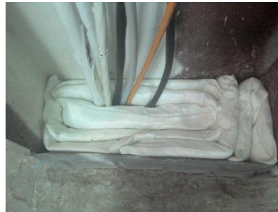
Уплотнение проходов кабелей