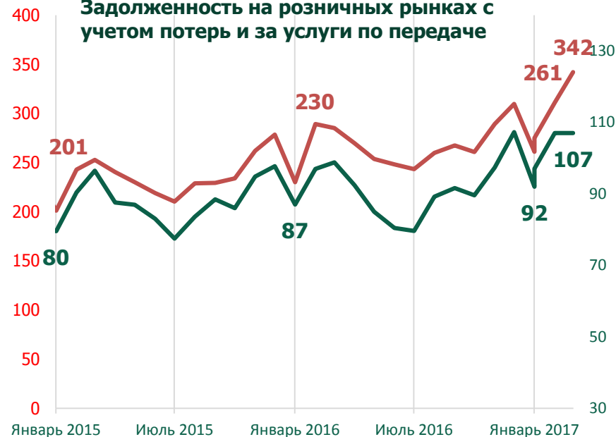
Задолженность на розничных рынках с учетом потерь и за услуги по передаче

— Потребленная э/э + потери — Услуги по передаче